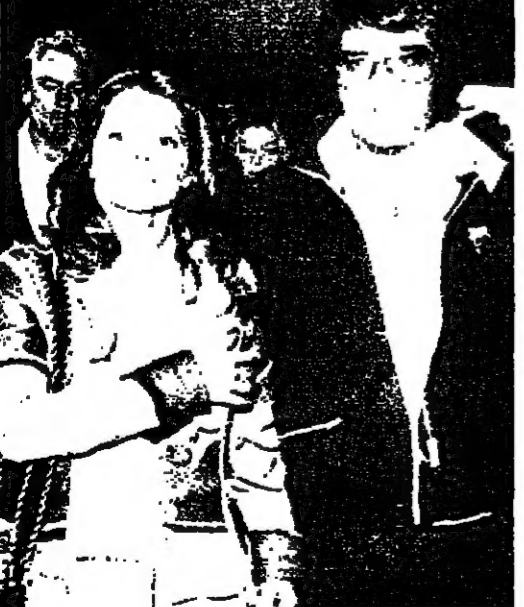
مع زوجته السيدة بريسل